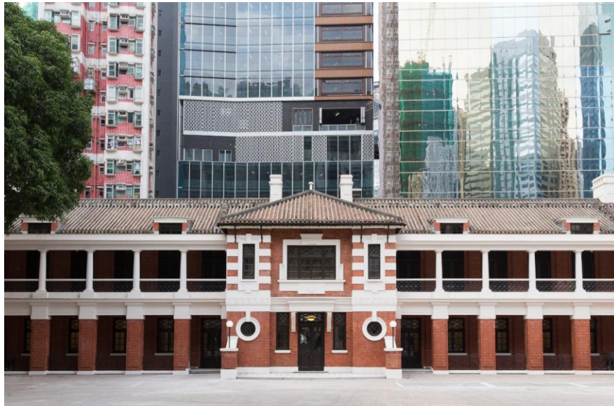
大館 — 古蹟及藝術館自開幕以來累計已吸引超過 800 萬人次到訪。